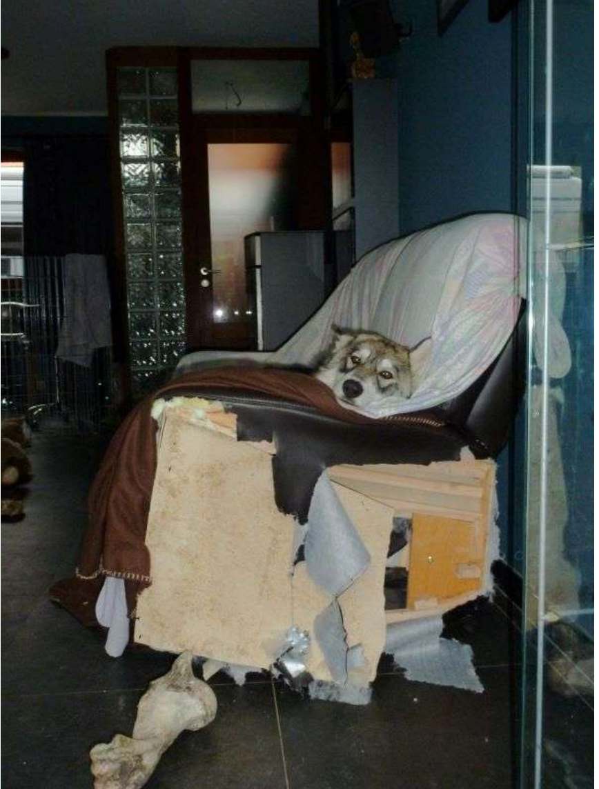
Coquine mais charmante Ayla, Gardez le sourire