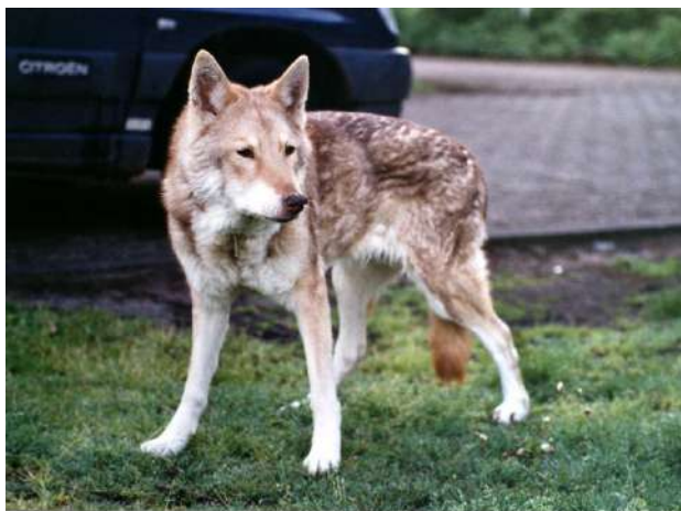
Nouchka à 15 ans lors de sa dernière promenade

Cela a été très dur pour moi, je savais que son heure était arrivée mais dans sa tête, Nouchka était encore si vive. J'ai eu du mal à accepter que ce soit le bon moment. Au crématorium, nous l'avons embrassée une dernière fois pour lui dire au revoir. Elle a laissé un grand vide dans notre cœur, mon premier chien-loup, mon grand amour.