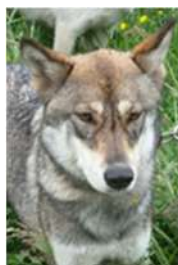
Yuna et Cayenne