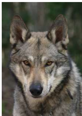
Yuma en Theya

Chacun sait à présent que les chiens-loups sont doués pour faire des bêtises. Mais ce que peu de gens savent, c'est qu'ils sont aussi de grands comédiens. Mon mari et moi l'avons appris l'été dernier. Un soir, nous étions tranquillement occupés à prendre notre repas quand Yuma, notre chien-loup Spencer est rentré tout paniqué, à bout de souffle, comme si une chose épouvantable s'était produite à l'extérieur.