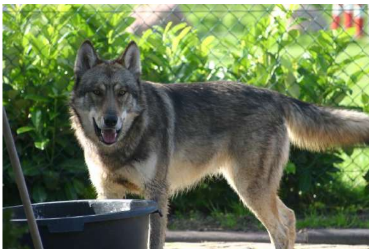
Uncas, le papa de Brzo

Vous êtes peut-être une des rares personnes à pouvoir passer du temps avec un de ces êtres merveilleux.