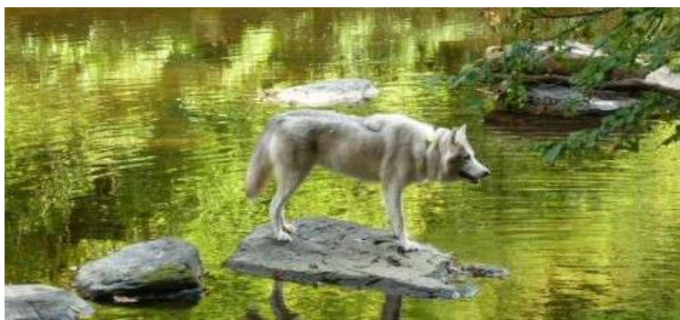
Chey en pelage d'été et d'hiver

grognement. J'étais effrayée sur le moment, est-ce normal? Il s'est avéré que oui. Chey peut se montrer très grincheuse, c'est sa façon de répondre à mes câlins. Lorsque je joue avec elle, il lui arrive de me montrer les dents comme si elle allait me dévorer mais c'est juste un amusement pour elle. Elle me mord légèrement avec un air féroce et cependant, elle est aussi joueuse qu'un chaton.