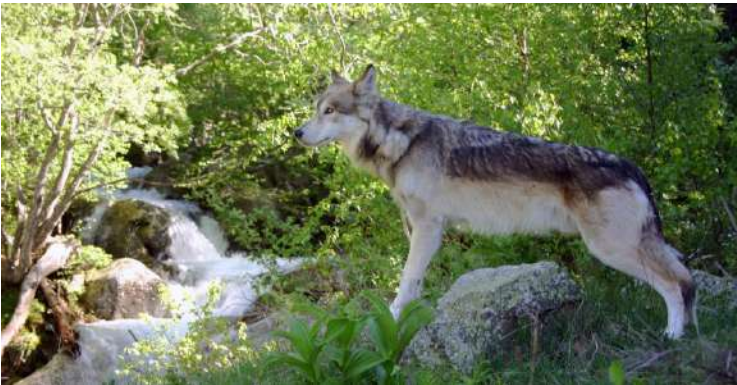
Brzo dans une scène du film «Dossier K»